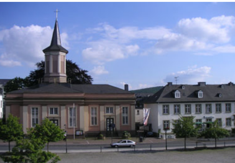
Arnberg, Baudenkmal Auferstehungskirche