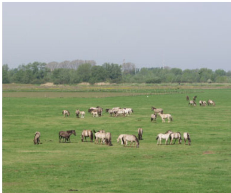
▽ Tiefland: Millingerwaard-Konincks

zes (UVP-Gesetz) im Jahre 1990, wurde der Begriff Kulturelles Erbe ersetzt durch den Begriff Kulturgüter. Dadurch sind immaterielle geistige Schöpfungen ausgeschlossen. Der Fachbeitrag schließt sich der Definition des Arbeitskreises an.