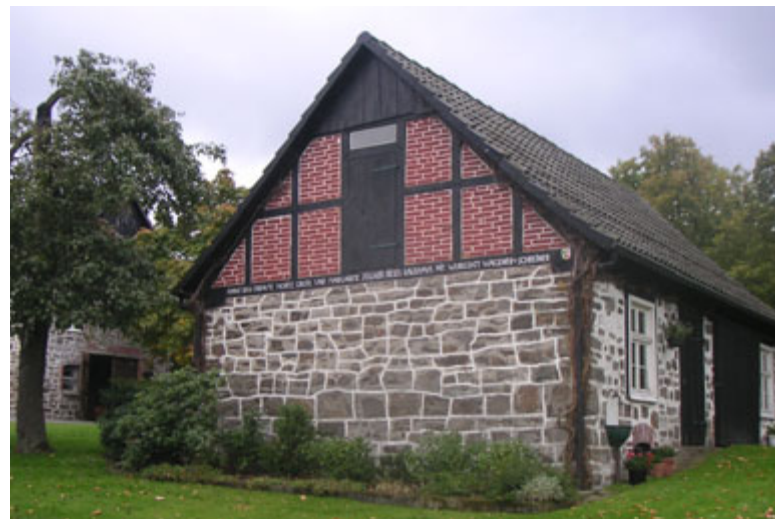
△ Altenhellefeld, Baudenkmal im Sauerland

Die immateriellen Bewertungskriterien sind an materielle gebunden, d.h. an die Bausubstanz ( oder das lebende Material der Landschaftsteile ), die ihrerseits wiederum die dinglichen Objekte als geschichtliche Quellen ausweisen. Sie ermöglichen Informationen über Material, dessen Be- und Verarbeitung sowie Gestalt der Bauten und Anlagen, über Veränderungen, Zerstörungen und Wiederherstellun-