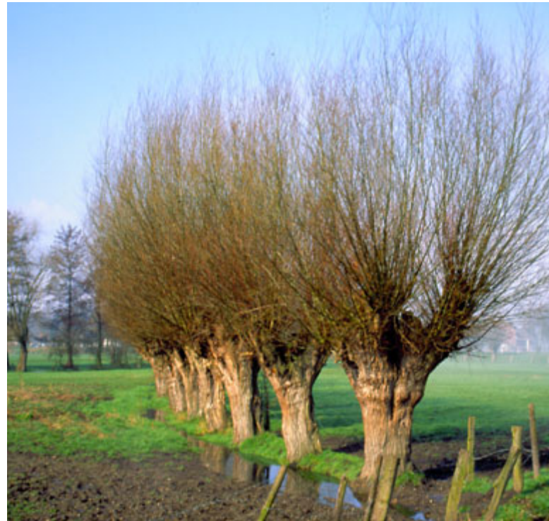
△ Kopfeiden sind charakteristische Vegetationselemente für Schwalm-Nette

zung, Bebauungsdichte, Siedlungs-, Bebauungs- und Stilformen, Baumaterialien, Industrie, Infrastruktur, Land- und Forstwirtschaft, Bergbau, Verkehrsflächen und Infrastruktur.