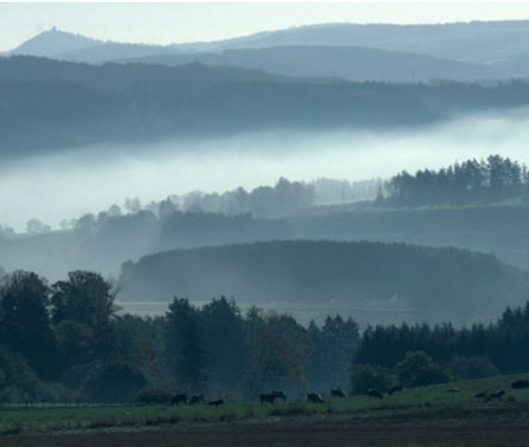
△ Bergland der Eifel