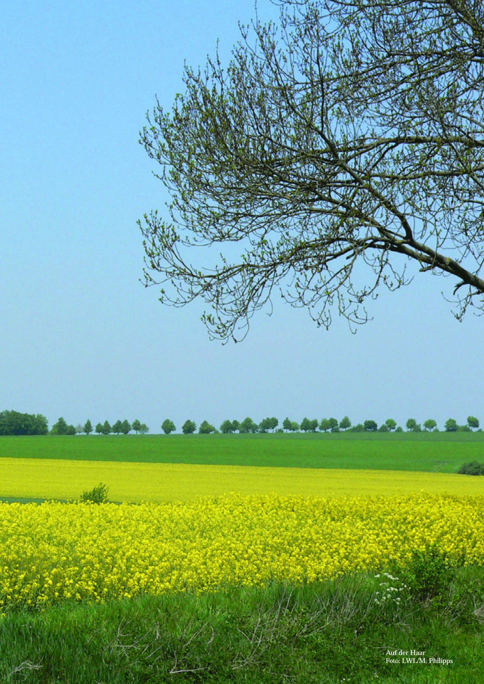
Auf der Haar