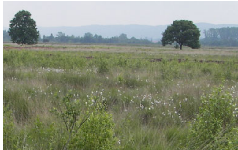
△ „Großes Torfmoor“ als Bodenarchiv

Bezogen auf das archäologische Erbe besitzen die Böden eine hervorgehobene Bedeutung. Sie stellen das Archiv dar, in welchem archäologische Befunde konserviert sind (vgl. Kapitel 5.2). Es sind all jene Böden hervorzuheben, die eine geringe Erosionsgefährdung und zudem einen stabilen Bodenwasserhaushalt aufweisen.