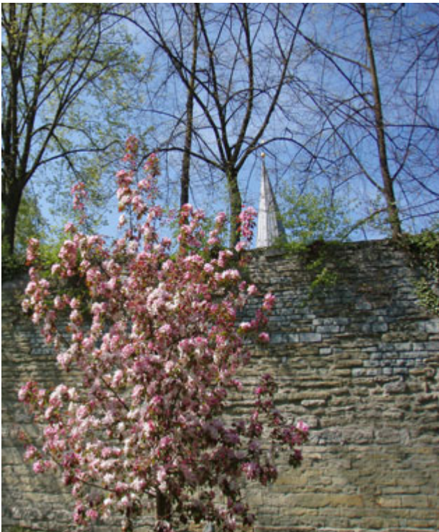
Der Erwitter Sandstein prägt die Stadt Soest. △ Foto: LWL/M. Philipps