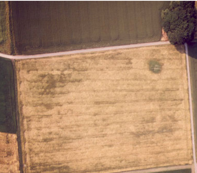
△ Bodendenkmal: Grabhügel der Bronzezeit, Borchon-Etteln

senschaftlichen Herangehensweise bei der Beurteilung von Denkmälern.