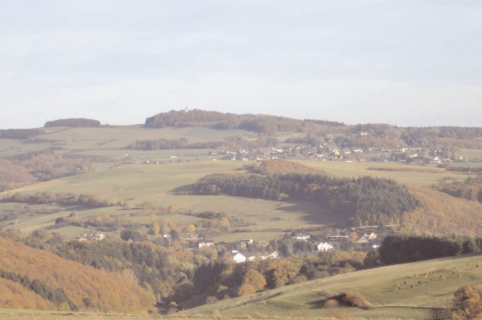
△ Michelsberg, ländlich-agrarisch geprägter Raum