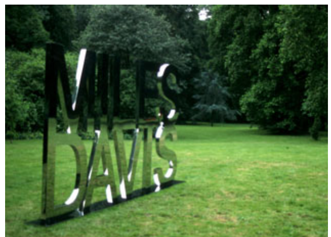
▽ Schlosspark Wendlinghausen, Gemeinde Dörentrup

Die künstlerische Wahrnehmungsebene bezieht sich auf die bewusste Gestaltung von Kulturlandschaftselementen durch den Menschen. Insbesondere die Architektur von Baudenkmalern einschließlich Park- und Gartenanlagen,