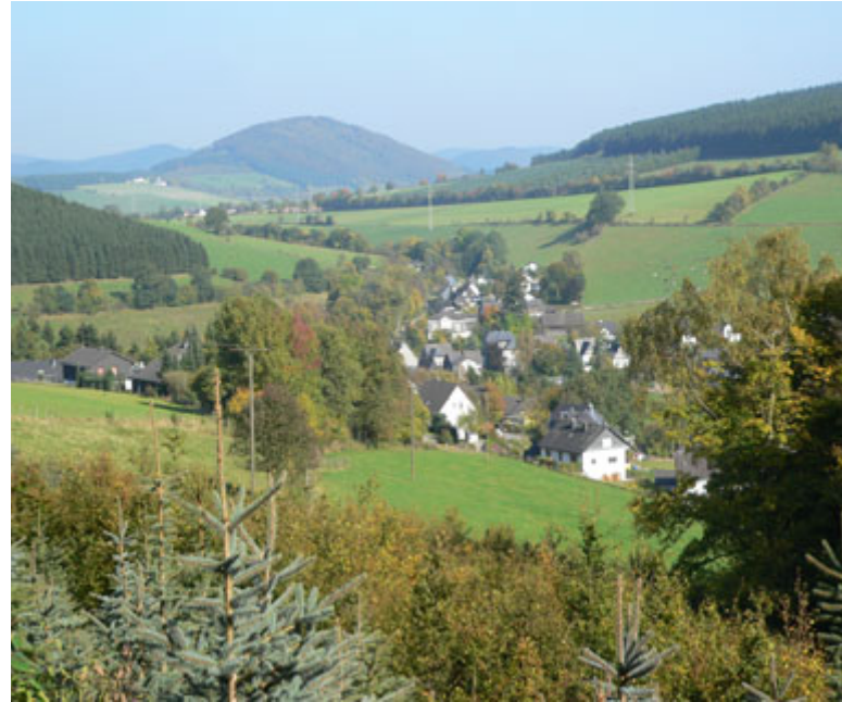
△ Mittelgebirge: Sauerland