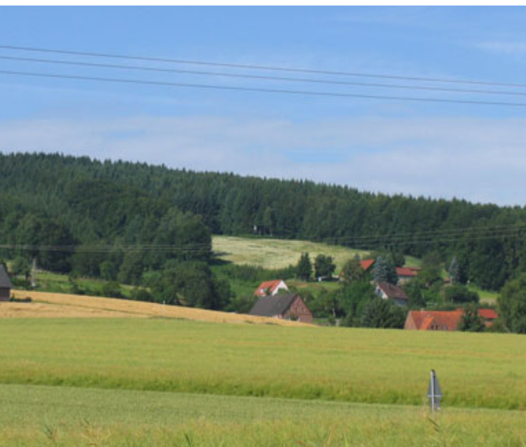
▽ Hügelland: Börninghausen am Wiehengebirge