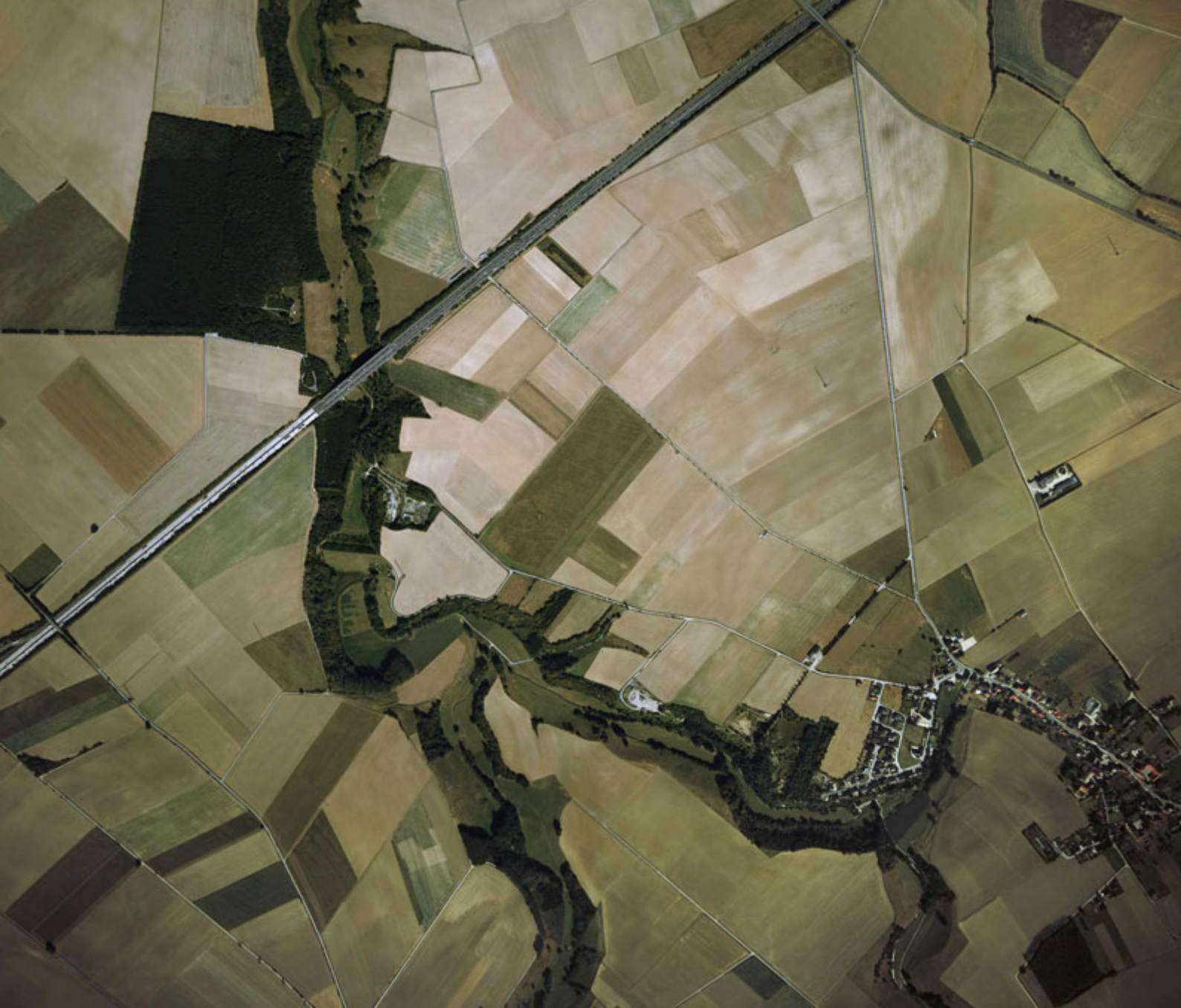
△ Naturschutzgebiet mit kulturhistorisch bedingten Biotoptypen: „Pöppelsche“ bei Erwitte

„Die Landschaft ist in ihrer Vielfalt, Eigenart und Schönheit auch wegen ihrer Bedeutung als Erlebnis- und Erholungsraum des Menschen zu sichern. Ihre charakteristischen Strukturen und Elemente sind zu erhalten oder zu entwickeln. Beeinträchtigungen des Erlebnis- und Erholungswerts der Landschaft sind zu vermeiden [...].“