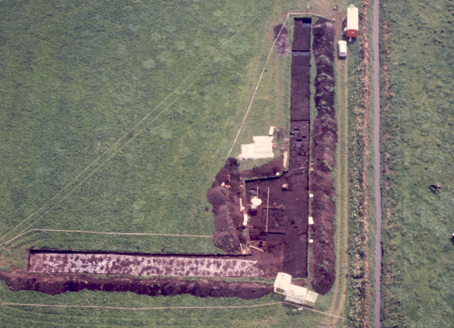
Moor als Bodenarchiv bei Hille-Unterlübbe